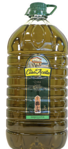
Castillo de Abiltas La Casa del Aceite