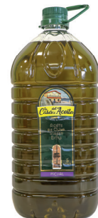
La Casa del Aceite