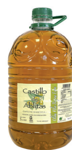
Castillo de Abiltas